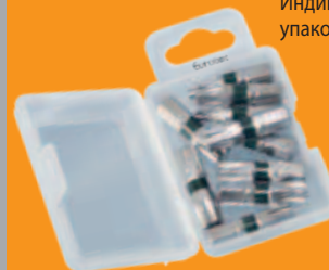
Упаковка насадок по 10 штук каждого размера